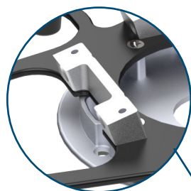
Blocs arrières et latéraux

Le Bracket Pro Serie® 25 - HD est testé en conformité avec la norme SAE J3043, la norme la plus rigoureuse de l'industrie pour le transport d'équipements médicaux.