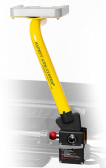
Safety Arm System®