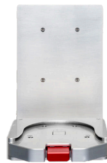
Wall Mount Pro